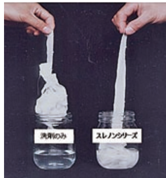
洗濯のみと比べて繊維を絡ませず、スムーズにする効果を付与する。

「ウエットクリーニング」ではレーヨン素材を採用した衣類が多くなり、トンド素材として脚光を浴びている点を挙げる。レーヨンは、パルプやコットン原料の再生繊維で特長として染色性が良く肌ざわりが滑らか、吸水性や光沢があり、美しく見える利点がある。反面、擦れることで色が白化しやすい、水シミがでやすいこと、また濡れることで強度が弱くなる、水系洗濯で縮みや歪みなどの欠点がある。