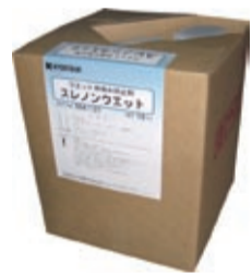
スレノンウエット

「新JIS」の洗濯表示がスターマークになる。注目は「商業ウエット」マークの導入。スーツやスラックス、デリケート衣類の多くはこの表示が付けられると予想される。先のレーヨン素材人気もそうだが、こうしたデリケート衣料の洗濯ニーズはますます増えていくことが「その前にトラブルを起さないウエットを